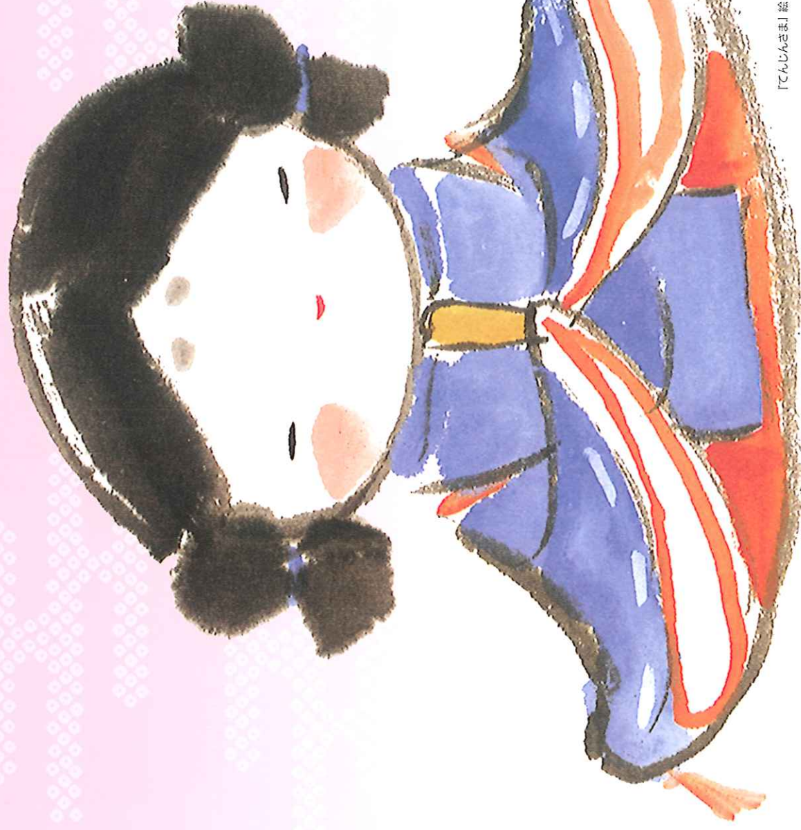
「せんじんさま」絵：西島伊三雄／文：森弘子（源の館社）