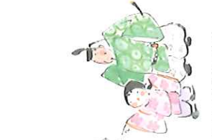
『てんじんさま』絵、西島伊三雄/文・森弘子(童の館社)